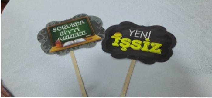
3. Mezuniyet kınası pankartları (2017)

Kadın öğrenciler mezuniyet kınalarını, erkeklerin yanında çekinen ya da oynamayı uygun bulmayan, oynamayı beceremeyen, kendini sakınan, başörtülü, başörtüsüz öğrenciler için oldukça keyif aldıkları; aşağıdan yapılan, kadınlar arası dayanışma biçimlerini artıran, arkadaşlıklarını pekiştiren yaratıcı eğlenme biçimleri olarak yorumlamaktadırlar. Bu eğlence, öğrenci popüler kültürü içinde hızla yayılmakta ve kadın öğrencilerin kendi deneyim alanları içinden farklı yorumlara kapı aralamaktadır: