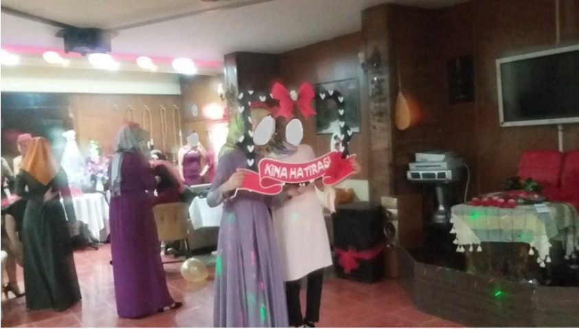
1. Mezuniyet kınasından bir fotoğraf (2017)

McRobbie ve Garber, orta sınıftan kız öğrencilerin eğitim alıp evlilikten üç ya da dört yıl caydıkları dönemlerde öğrencilerin kişisel tarzlarını geliştirecek daha çok serbest vakte sahip olduklarını belirtir (2003, 219). Üniversitede geçirilen serbest vakitler de henüz iş yaşamına adım atılmadan önceki son evre olarak görülebilir. Üniversitenin bitmesiyle genç yetişkin evreye adım atan kadın öğrenciler, aile üyelerinden gelecek beklenti ve isteklerin farkında olduklarını kartonlara yazdıkları sözcüklerle belli ederler. Öğrencilerin süslü ve resimli kartonlarında; “yeni mezun-taze işsiz,” “kına hatırası,” “dikkat son öğrenci pozum,” “taze mezun,” “sonunda bitti anneec,” “daha da okumam” ve “kaptım diplomayı” gibi yazılar vardır. Yazılar eşliğinde öğrenciler fotoğraf çektirirken, elden ele geçen büyük çerçeve pankartındaki “mezuniyet hatırası” yazısı ile de topluca fotoğraf çektirilir. Pankartlardaki süslü yazılar, öğrencilerin mizahını da içeren bir dille eğlencenin ve çektilen fotoğrafların birer parçası haline gelmiştir. Yazılar, ağırlıklı olarak işsizlik ve üniversite eğitiminin süresinin uzunluğuna işaret eder. Pankartlardaki yazılar, aileden özellikle anneye seslenen ve öğrenciye üniversite eğitim hayatı boyunca sorulan sorulardan oluşur. Üniversite devam ederken “ne zaman bitecek?” “kaç sene kaldı?” gibi sorulara kadın öğrencilerin verdikleri cevaplar, alaycı bir üsluba sahiptir.