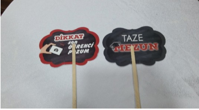
2. Mezuniyet kınası pankartları (2017)