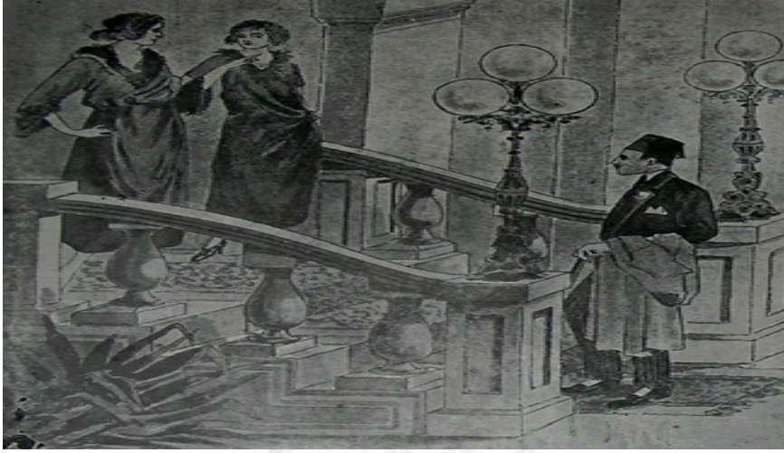
Resimli Ay, Haziran 1341/Haziran 1925, Sayı.17, s. 35.