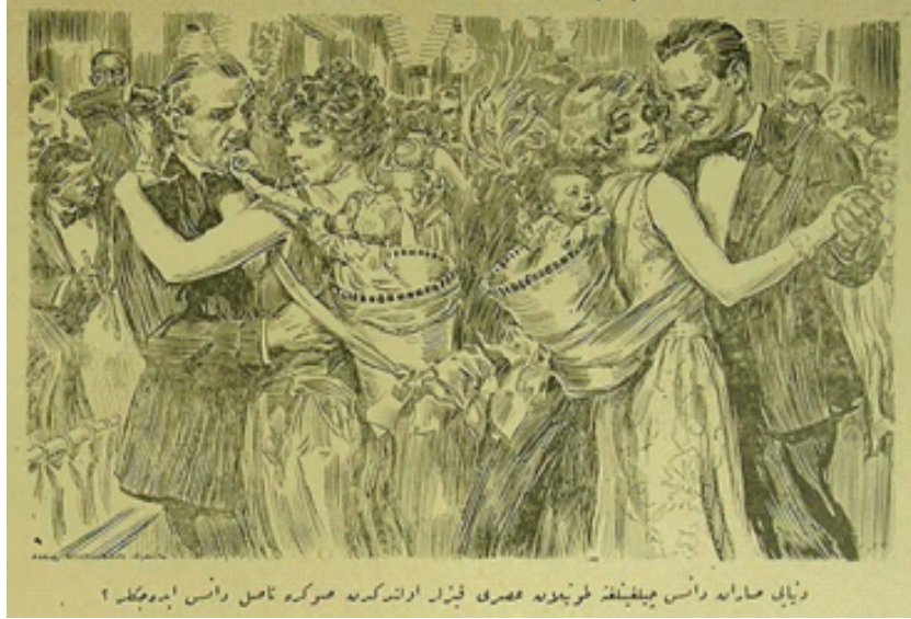
Resimli Ay, Ağustos 1341/Ağustos 1925, Sayı.19, s. 10, (Dünyayı saran dans çılgınlığına tutulan asri kızlar evlendikten sonra nasıl dans edecekler?).

“Hayatın bütün yükü bu zavallı kadının sırtına yüklenmiştir. O hem zevcedir hem annedir hem hayat kadınıdır. Bu üç büyük yükün altında omuzları çökmüş kemikleri kırılmış kadın hayatını kazanmak için tütün fabrikasında çalışır evlerde çamaşırlar yıkar. Pazar yerinde ekmek satar, sebze satar kocasının doyuramadığı sefaya bir dilim ekmek katabilmek için günde on dört saat çalışır. Kocasını adi bir ameledir. Ticari ve sınai bir buhran onun işten kovulmasıyla sonuçlanmıştır. Hastalık ve ölüm bu ailenin her günlük misafiridir. Say ne kadar çok olsa sefalette o kadar çoktur. Fazla say vücuduyla ödenir” (Melahat 1340a, 30).