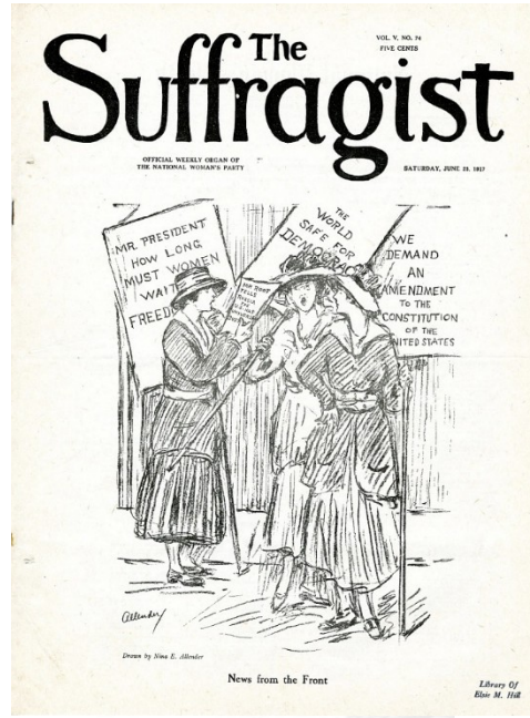
Resim 5: "Oy Hakkı Savunucusu" gazetesi, 23 Haziran 1917 tarihli sayısı

Yirminci yüzyılın başlarında ortaya çıkan gazete ve dergi gibi kitle iletişim araçları, Oy Hakkı Hareketi'nin kolektif kimliğini oluşturan temel araçlar haline gelmiş, kadınlar argümanlarını, çok daha geniş kitlelere yayma imkânı bulmuştur. Okuryazarlık oranı yüksek olan Oy Hakkı Hareketi örgütleri, kendi gazetelerini basmaya başlamış, NAWSA, adı daha sonra "Kadın Yurttaş" olan "Kadının Günlüğü" gazetesini, NWP ise 1913'te "Oy Hakkı Savunucusu" gazetesini, haftalık süreli yayın olarak çıkarmıştır.