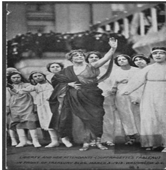
Resim 1: "Özgürlük ve Nedimleri", Hazel MacKaye, 1913.

3 Mart 1913'te, Washington'da düzenlenen ilk ulusal oy hakkı geçit töreninin en dikkat çekici etkinliği, koreograf Hazel MacKaye'nin ürettiği "Özgürlük ve Nedimleri" adlı alegorik tablo olmuştur. ABD tarihinde, Hazine Bakanlığı binasının büyük merdivenleri, çalışma saatleri içinde ilk kez feminist ve sanatsal bir gösteri için kullanılmıştır. Bu performans, kadın ve çocuklardan oluşan yüz kişilik dev bir kadroyla özgürlük, adalet, barış, dayanışma ve umut gibi idealleri temsil etmek, aynı zamanda Sappho ve Jan Dark gibi olağanüstü tarihi kadın figürlere yer vermek için tasarlanmıştır (Library of Congress). Yirmi binden fazla kişinin izlediği bu gösteride, kadınlar, kendi mücadelelerini temsil eden kadın portrelerinin yanında, kadınlık, güç, kahramanlık ve vatandaşlık gibi değerleri sembolize etmiştir (Scarborough 2015).