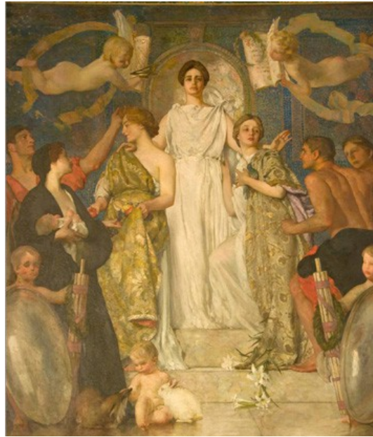
Resim 3: “Kanunun Adaleti” Edward Simmons, 1899.

Oy Hakkı Hareketi, notasal dilden farklı olarak çizimi de bir mücadele dili olarak kullanmıştır. Resim sanatının bir formu olarak kullanılan duvar resimleri, yirminci yüzyılın başlarında, popüler sanat biçimlerinden biri olarak alegorik bir geleneğe dayanmaktadır (Baltz 1980). Özellikle dönemin kamu binaları için oluşturulmuş alegorik duvar resimleri, kadın mücadelesini öne çıkarmakta (Moore 2004), kamu binalarının duvarlarına çizilerek geniş kitlelere daha çok hitap etmekte ve demokratik değerleri geliştirme amacı taşımaktadır (Baltz 1980).