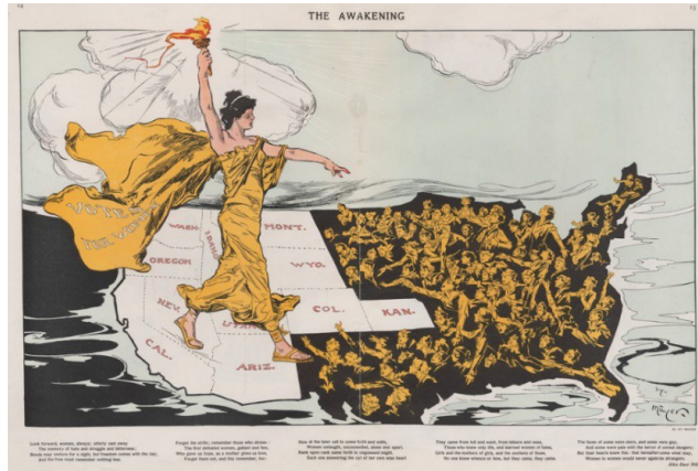
Resim 4: “Uyanış” , Henry Mayer, 1915, Puck Dergisi.

Aynı zamanda, kadının elini öne uzatma biçimi, Michelangelo’nun “Adem’in Yaratılışı” (The Creation of Adam) eserindeki Tanrı’nın Adem’e dokunma anındaki yaratılış fikrini hatırlatırken “Uyanış” adlı çalışmada da kadının, karanlıktaki kadınlara dokunmak için uzattığı el, kadınlar için yeniden yaradılışı ve uyanışı imlemektedir. Kadın figürü, güç, özgürlük, kararlılık, dirençlilik, umut, diğer kadınları aydınlatma ve onlarla dayanışma gibi duyguları açığa çıkardığı ve izleyicide bu duyguları uyandırdığı için feminist bir kimliğin oluşmasında da etkili olmaktadır. Ek olarak çizimsel bir dille üretilen kadın figürü, kültürel-ekonomik modelin de vurguladığı gibi aktivist halkla ilişkilerde anlamların üretilmesi, müzakere edilmesi ve egemen söylemlere direnme potansiyelini taşımakta ve toplumsal adaletin sağlanması adına bu söylemler, toplumsal değişimi hızlandırabilecek kapsayıcı politikalar üretmektedir.